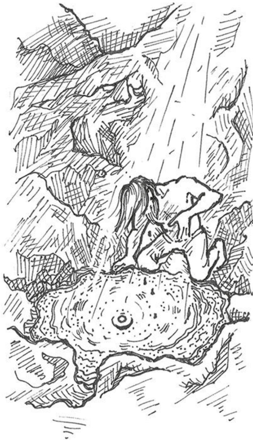
Figura 17 - O Olho no Poço.