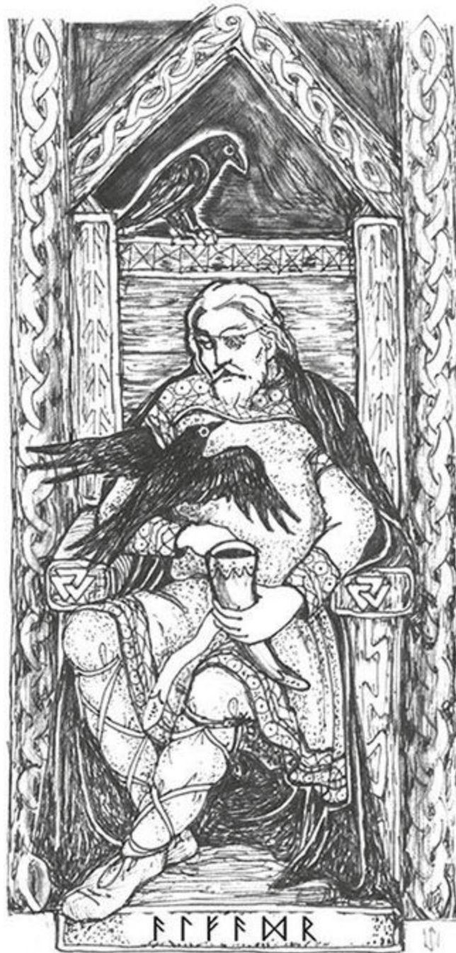
Figura 10 - O Pai Supremo.