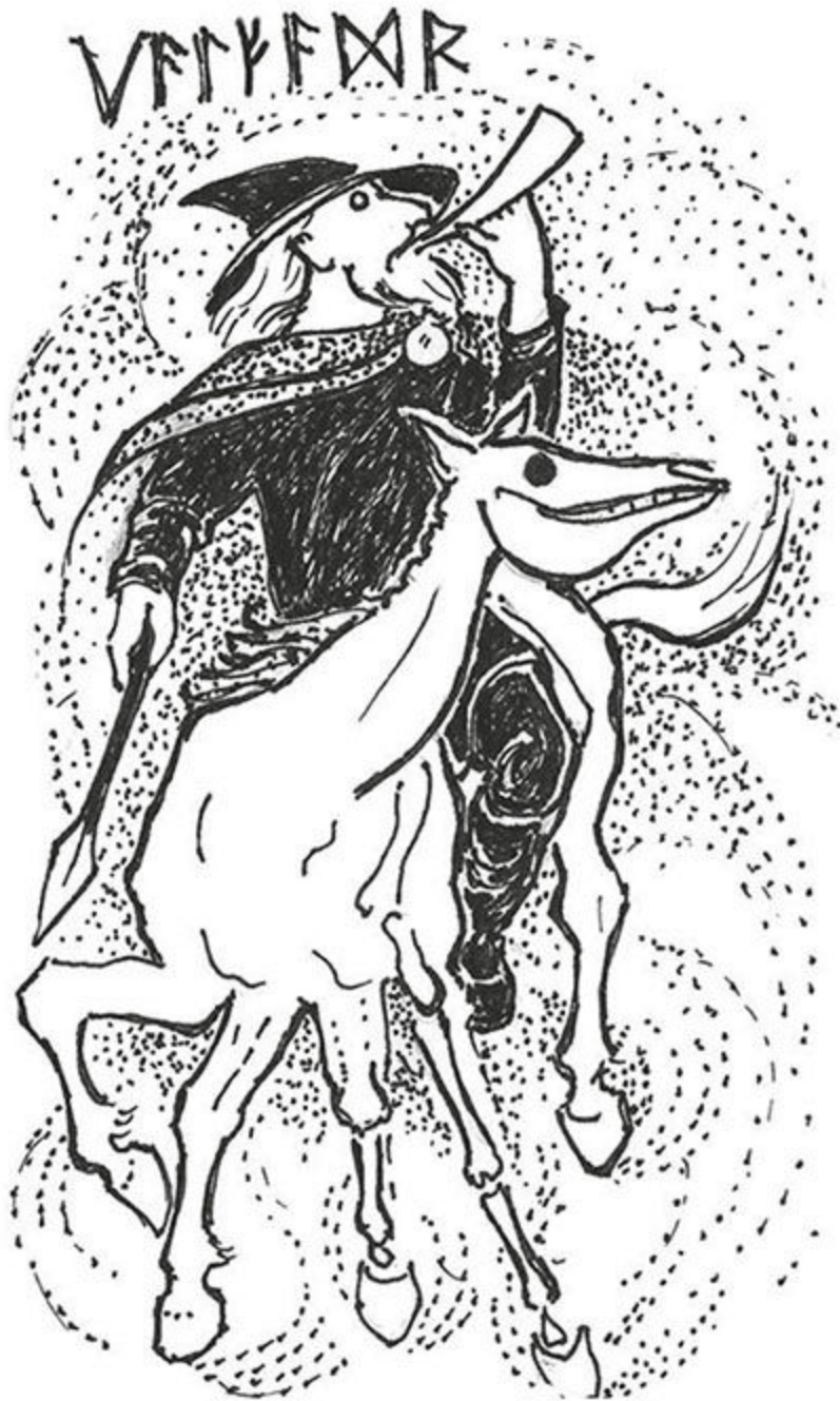
Figura16 - Odin cavalga com a Caçada.