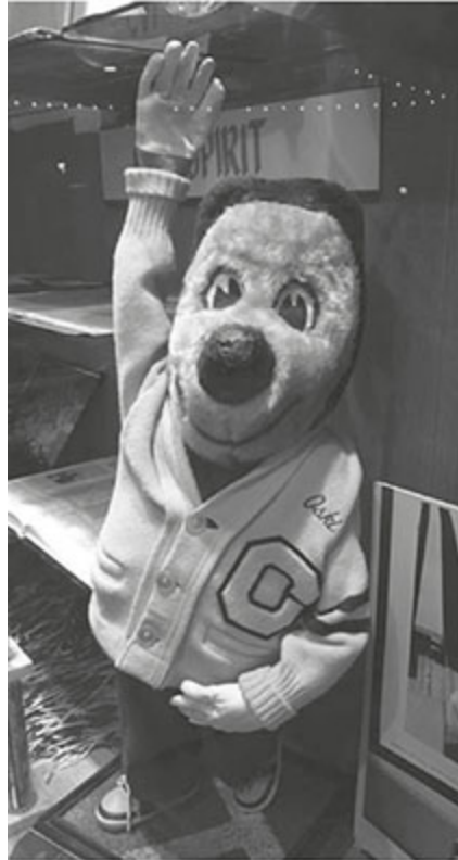
Figura 13 - “Oski,” o urso totem da Universidade da Califórnia, com o nome bordado na jaqueta (da vitrine dos ex-alunos da UC).

Tendo em vista que Bjorn , “Urso,” e Bjarki , “Ursinho,” estão relacionados por Price entre os nomes de Odin como metamorfo, meus amigos e eu tendemos a encará-lo como um dos aspectos de Odin. Flores são às vezes deixadas diante da sua estátua antes de um jogo especialmente importante.