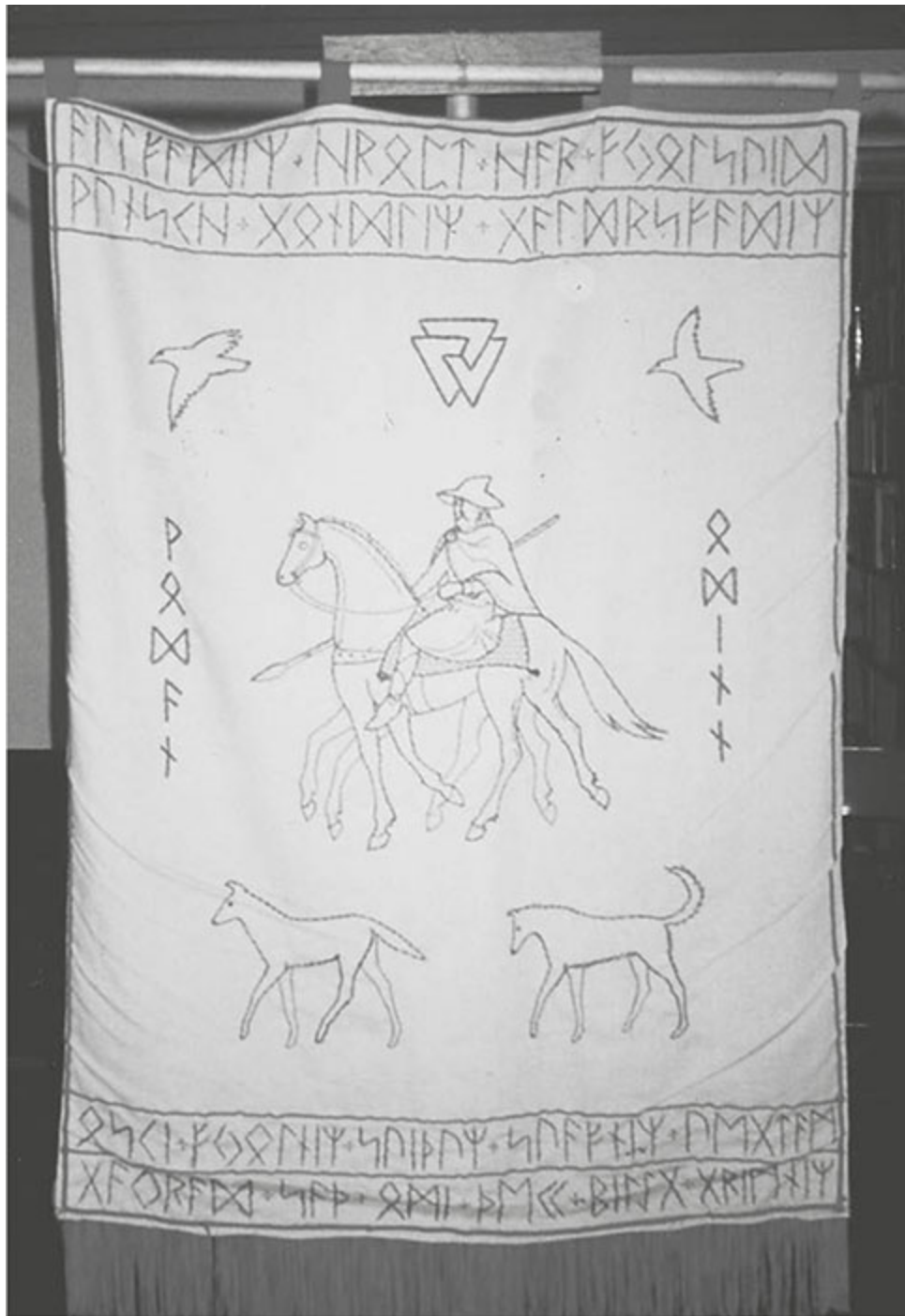
Figura 1 - Bandeira retratando Odin, de uso ritual, bordada por Diana L. Paxson.