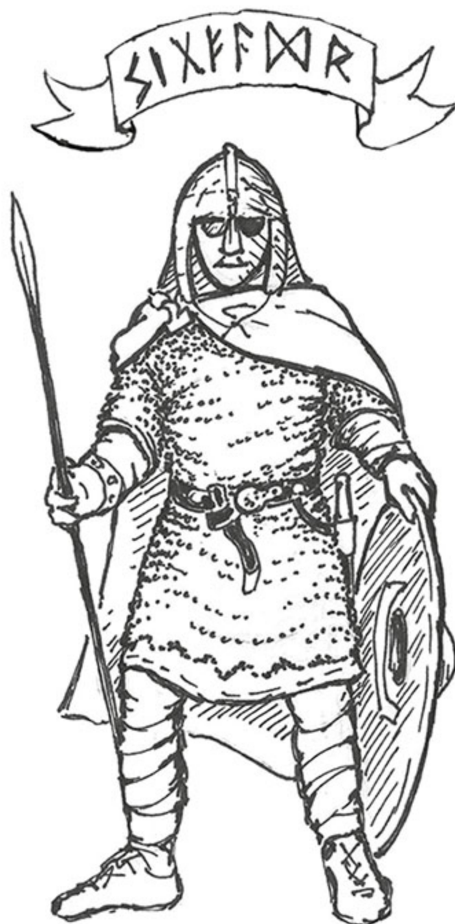
Figura 14 - Sigfadhír.