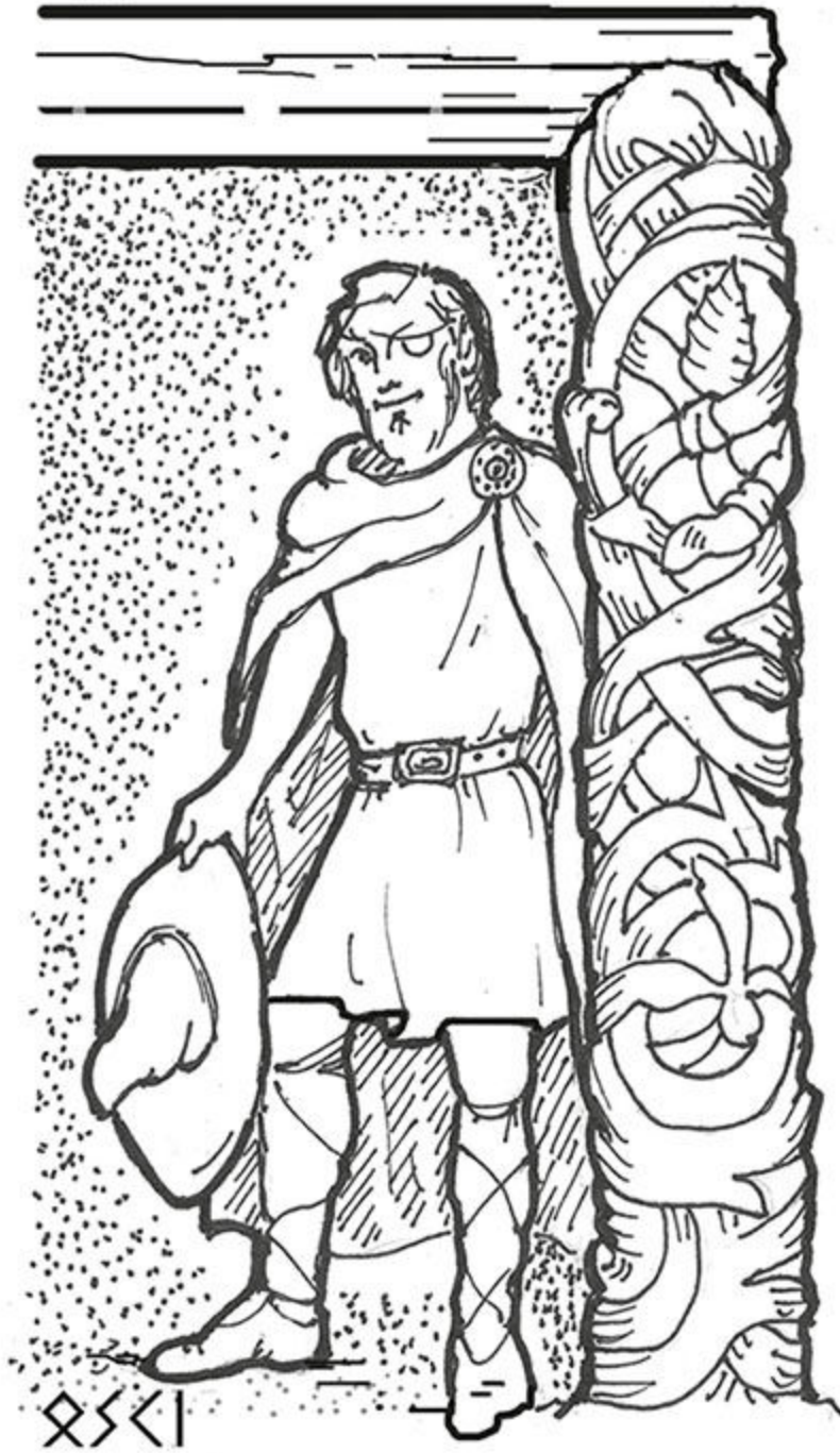
Figura 12 - Oski.