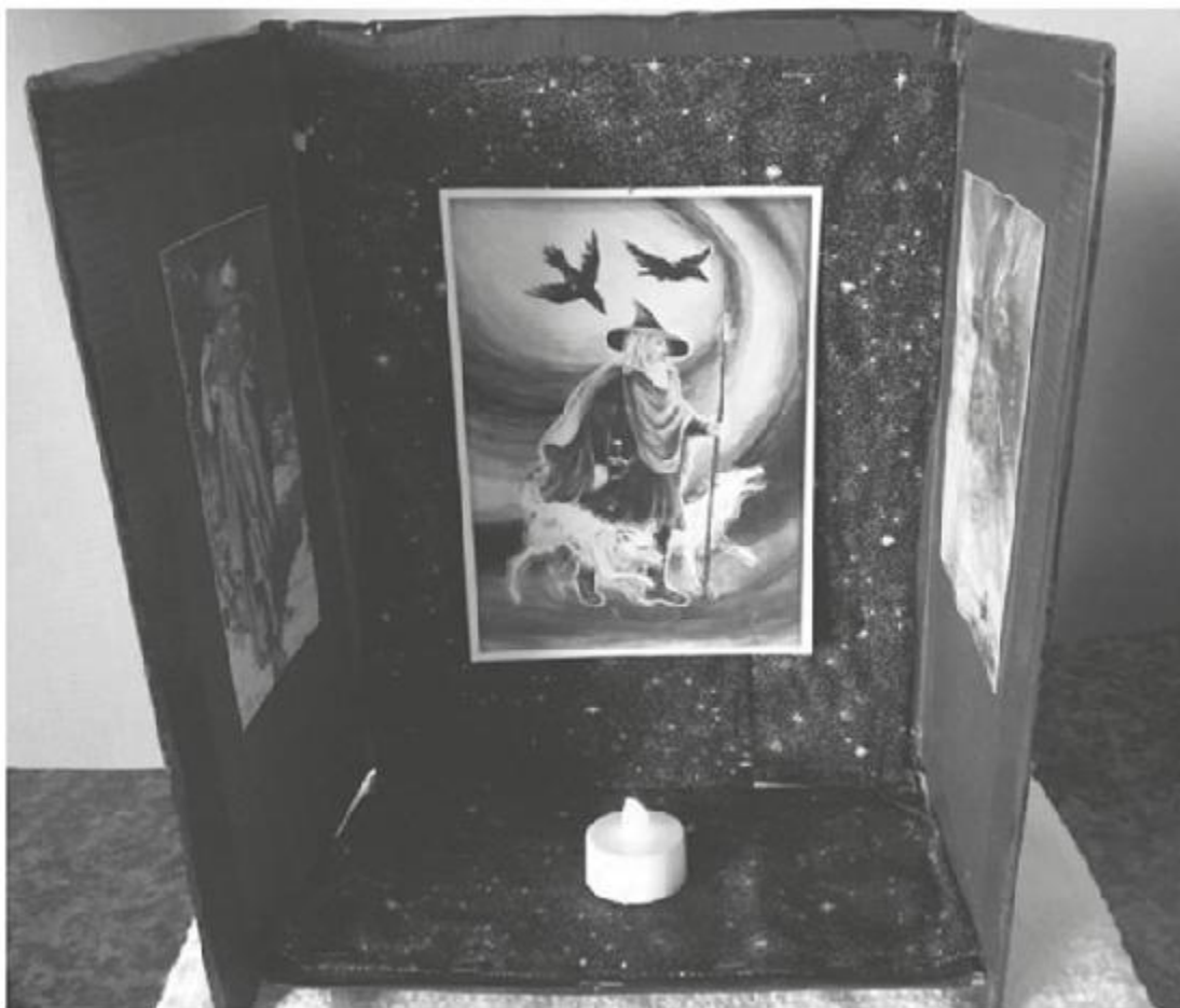
Figura 3 - Altar portátil para Odin.