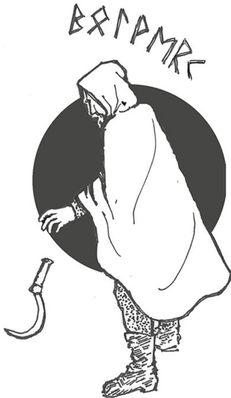
Figura 15 - Bölverk.