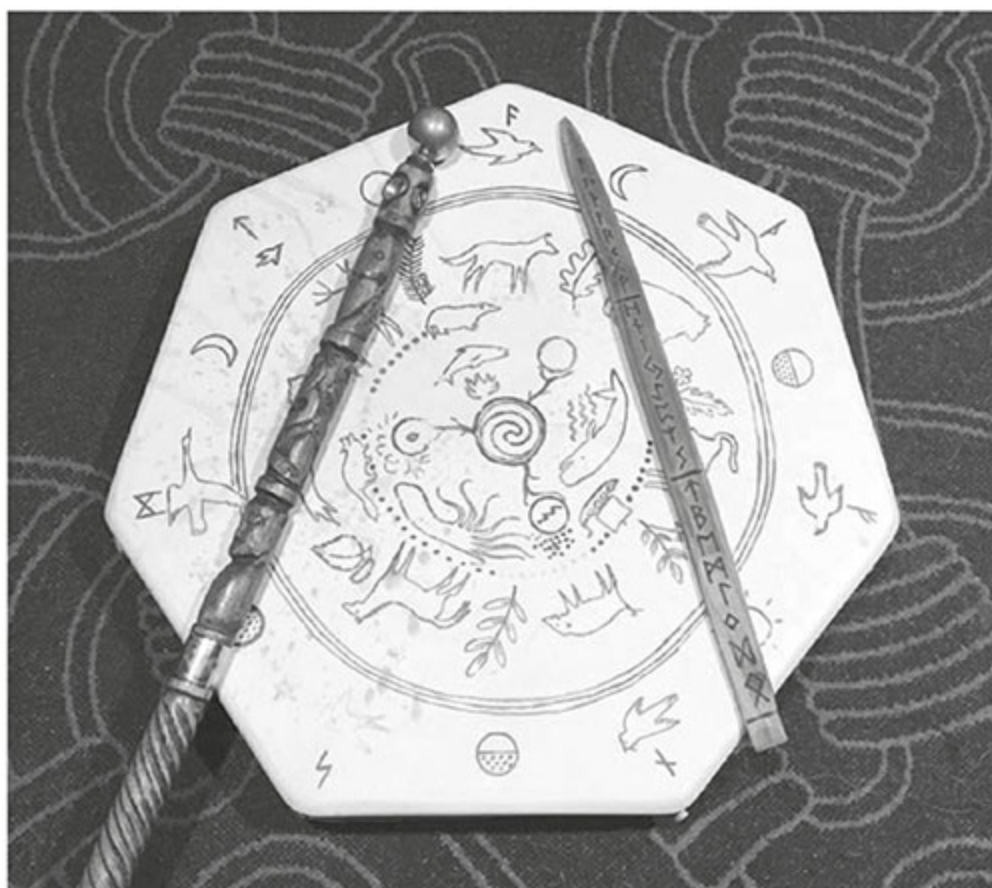
Figura 7 - Bastão de seidh , vara e tambor.

Desde o momento em que comecei a trabalhar com Odin, criei e colecionei diversos instrumentos de magia, entre os quais um bastão de seidh , uma vara de runas e um tambor.