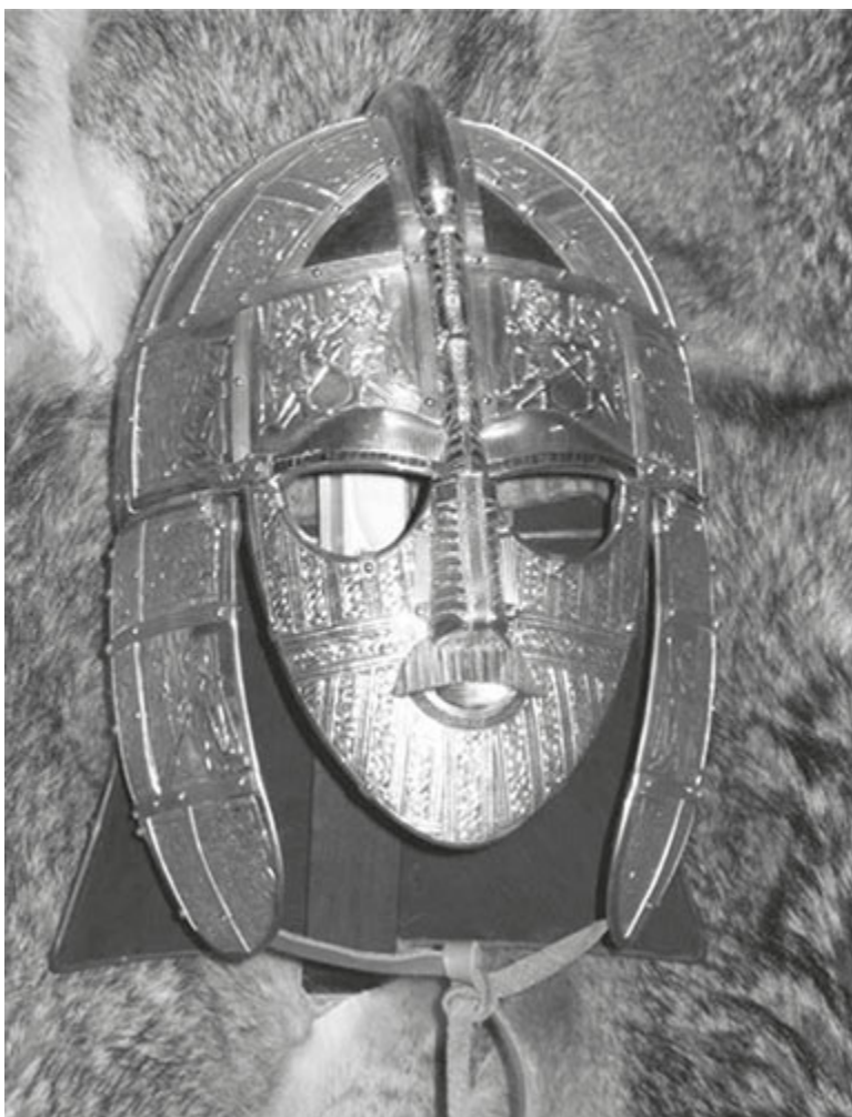
Figura 11 - Reprodução do elmo de Sutton Hoo.

ou alterado para que dê a impressão de que não existe. Experimentos com uma réplica do elmo de Sutton Hoo demonstraram que “observado em recinto fechado à luz tremeluzente do fogo, aquele que usava o elmo era caolho” (Price e Mortimer, 2014, p. 522). Eles concluem que uma semelhança com Odin era pretendida para respaldar a mística da realeza.