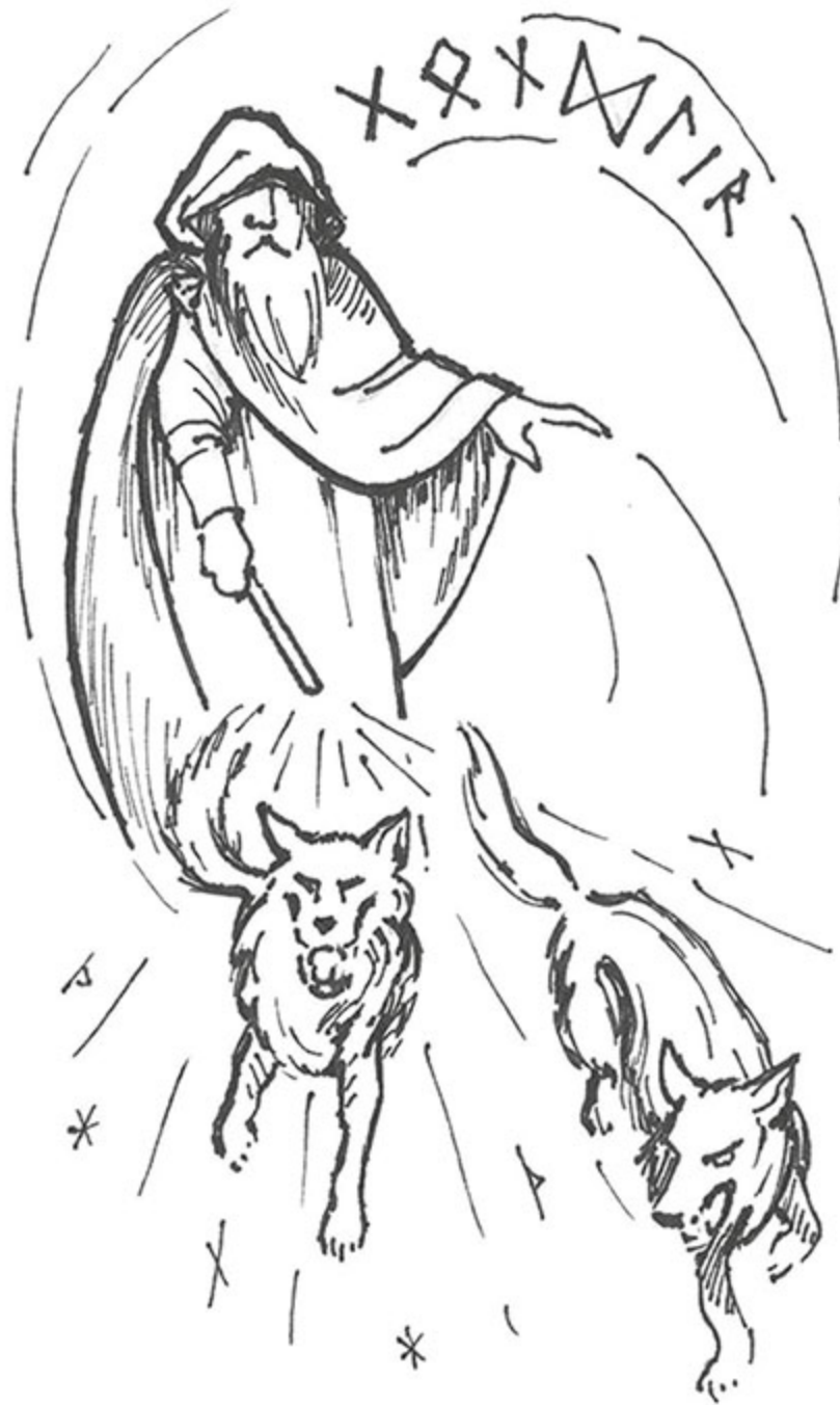
Figura 6 - Göndlir.