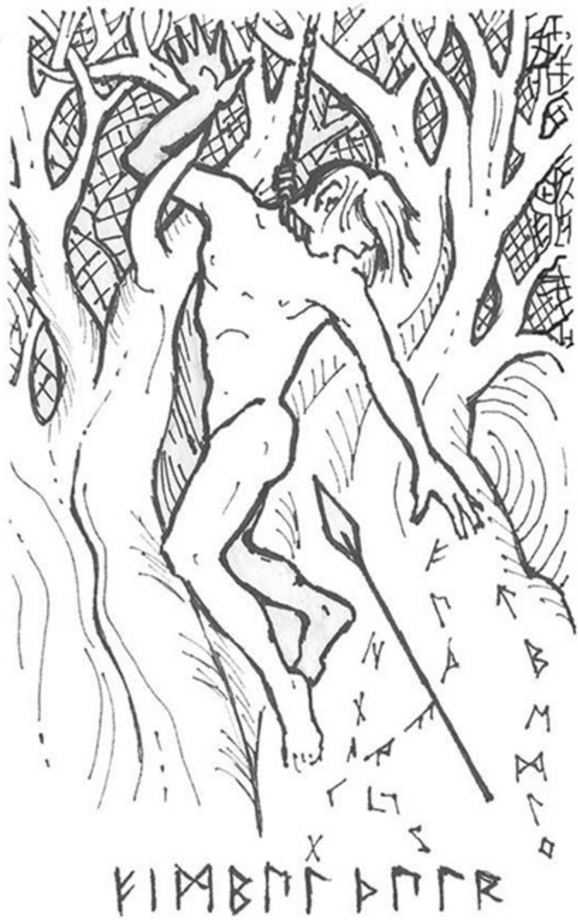
Figura 8 - Odin na Árvore.