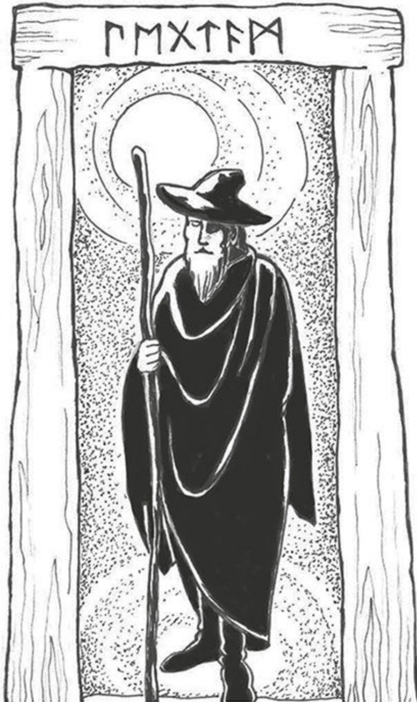
Figura 4 - "Vegtam".