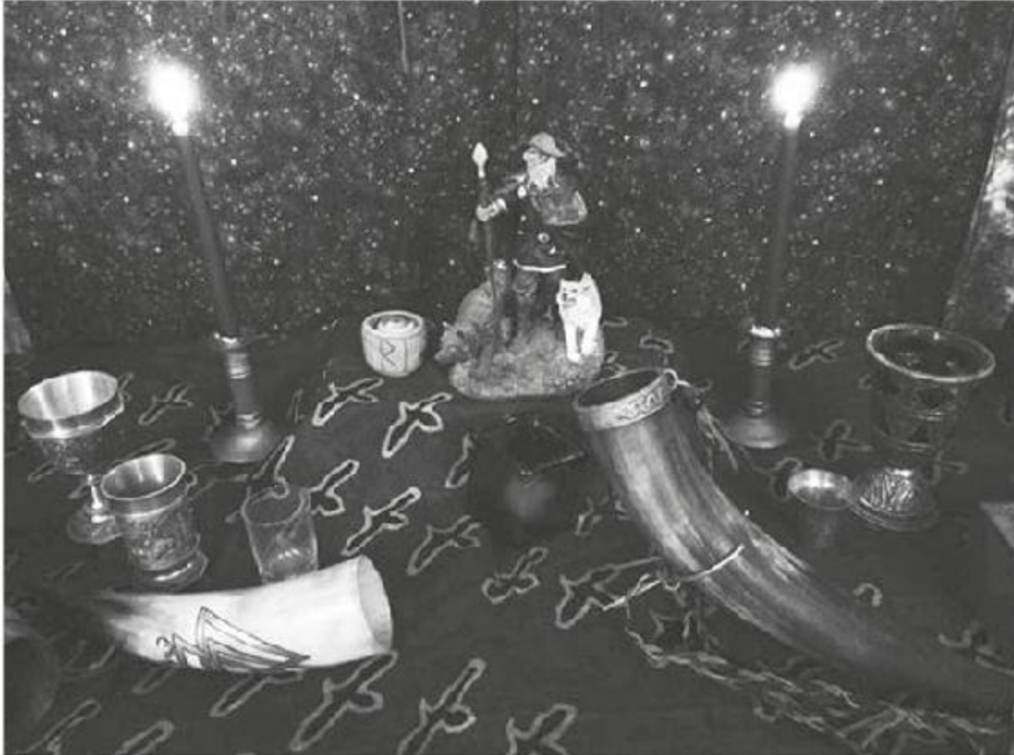
Figura 18 - Um altar para Odin.

Este é um ritual simples que pode ser realizado às quartas-feiras, ou em qualquer ocasião em que você precise homenagear o deus. Se estiver realizando o ritual com um grupo, distribua os versos entre os participantes.